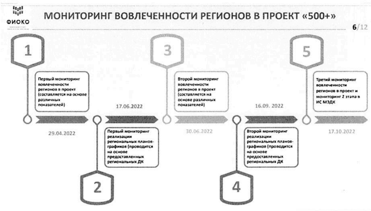
Рисунок № 2